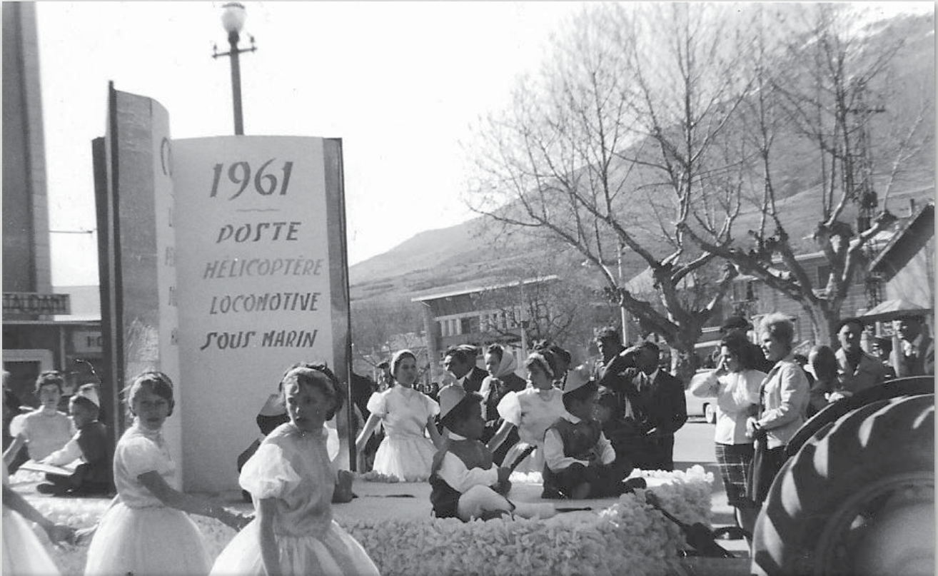
Un char porte un livre ouvert sur les pages duquel figurent le nom des chars qui défilèrent ce jour-là. En arrière-plan, on voit la nouvelle Poste inaugurée depuis peu de temps et, sur la droite, on devine le Foyer-Cinéma, qui sera détruit quelques années plus tard pour laisser place à l'ensemble formé par la salle des fêtes et le cinéma le Roc.