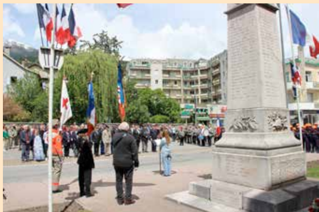
Lecture du message ministériel pendant la cérémonie.