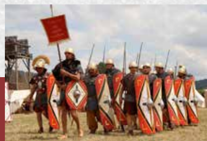
Reconstitution historique.

A u début de l'Antiquité, notre département est occupé, dès le V e siècle av. J.-C., par plusieurs tribus celto-ligures