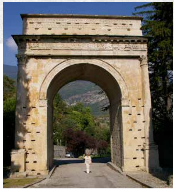
L'Arc de Suse sur lequel sont inscrites les peuplades conquises par Rome, dont celle des Caturiges qui avaient pour capitale Ebudodunum.

« A Allia Vera|na, sa fille | très chère | Vlattia Valerina sa mère| a fait ce monument de son vivant ».