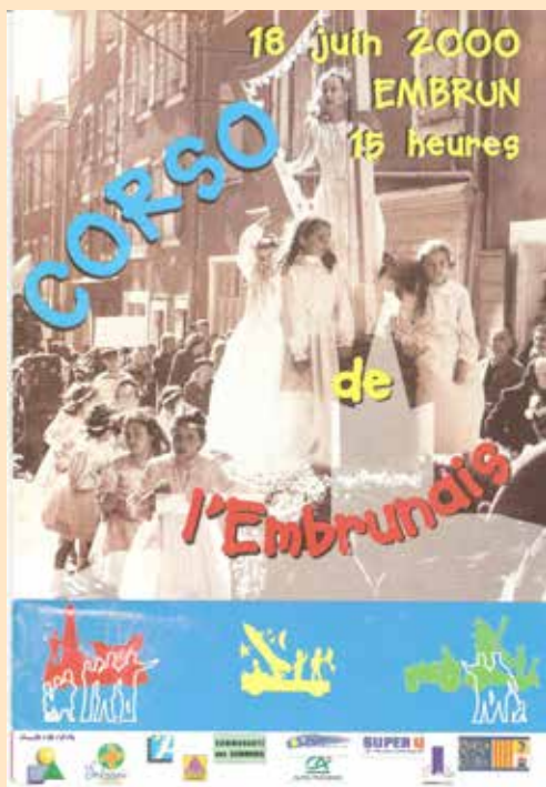
Document diffusé lors du corso du 18 juin 2000.