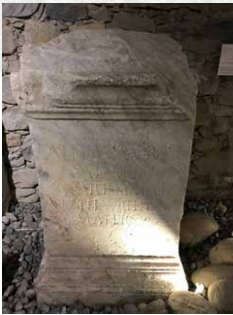
Stèle conservée au Musée Museum départemental de Gap.