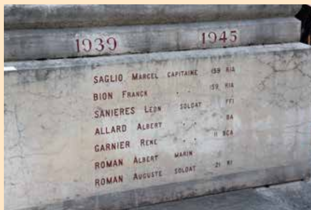
Embrunais morts pour la France au cours de la 2 e Guerre Mondiale.