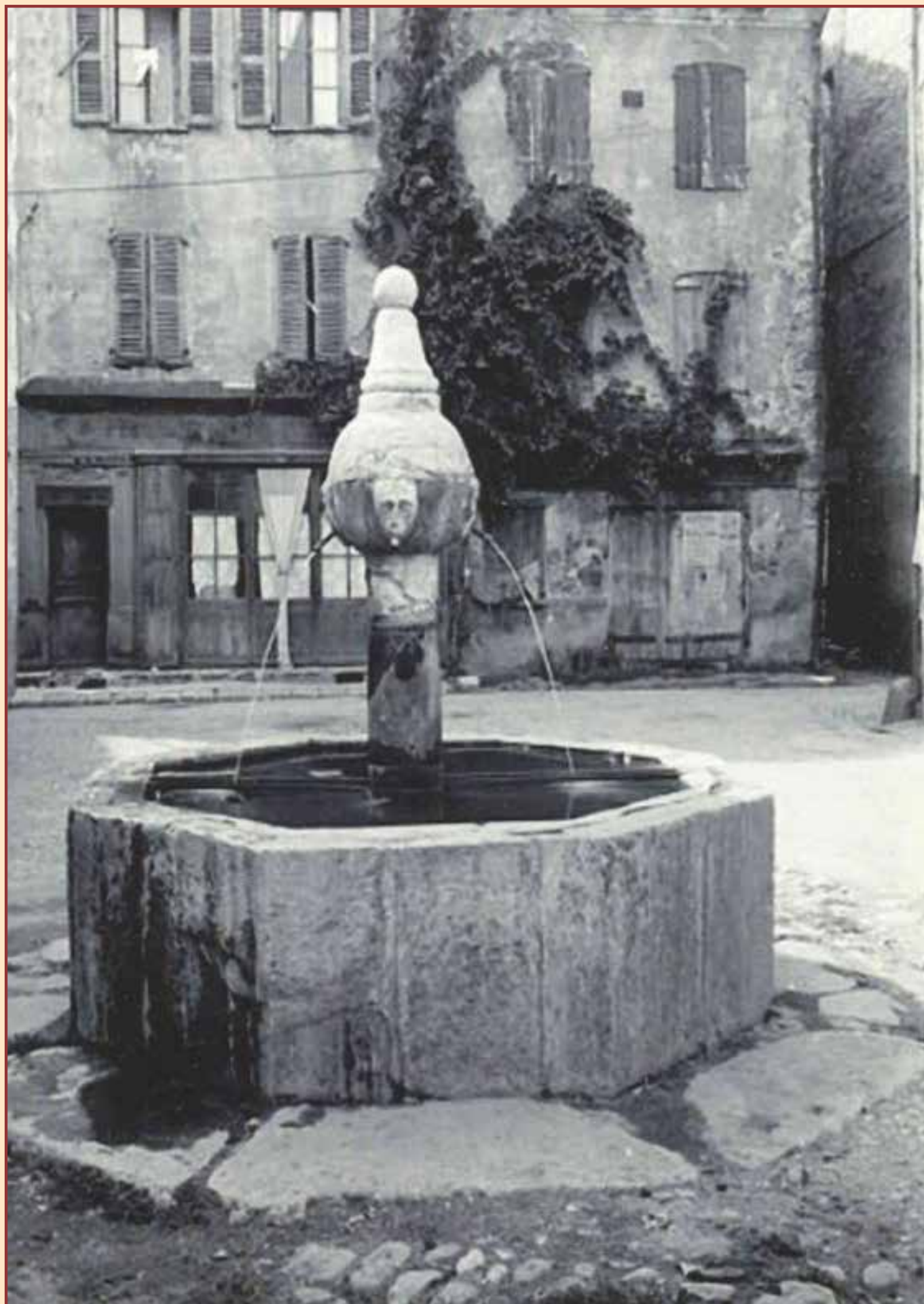
Place Dongois. La fontaine que nous connaissons toujours aujourd'hui ; la façade du café du Tilleul avec le bâtiment en cours de réfection actuellement et, à côté, la vieille bâtisse démolie pour permettre l'élargissement de la rue Neuve (rue Victor Maurel aujourd'hui).