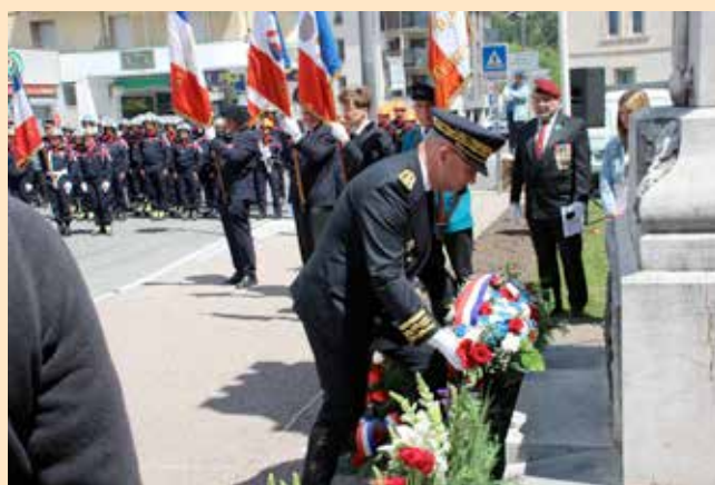
Le préfet des Hautes-Alpes dépose une gerbe au pied du monument aux Morts.

Le 8 mai 2026, la commémoration de la victoire sur le nazisme a rassemblé quelques dizaines d'Embrunaises et d'Embrunais, les autorités civiles, militaires et religieuses, avec la participation d'un détachement en nombre des sapeurs-pompiers ainsi que la musique municipale. Le préfet Philippe Bailbé était aux côtés de Chantal Etméoud, maire d'Embrun.